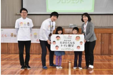
『みんなが行きたくなるトイレ』贈呈式