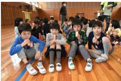
ラブレ菌を含む乳酸菌飲料の飲用