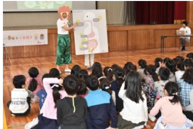
『おなかを元気にする授業』