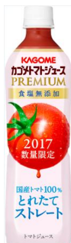
カゴメトマトジュースプレミアム 食塩無添加 スマートPET 720ml

※1:出典:インテージ SRI トマトジュースカテゴリ/2017年1月-5月累計/販売金額ベース、前年比