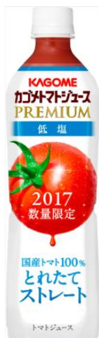
カゴメトマトジュースプレミアム 低塩 スマートPET 720ml