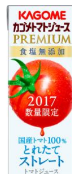
カゴメトマトジュースプレミアム 食塩無添加 200ml