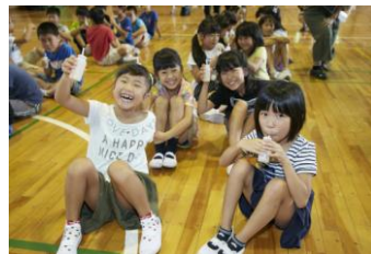
ラブレ菌を含む乳酸菌飲料の飲用