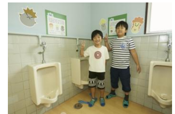
トイレ空間改善後