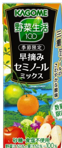
野菜生活100 早摘みセミノールミックス

http://www.kagome.co.jp/company/news/n.pdf/170111002.pdf