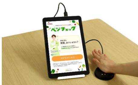
「ベジチェック」測定風景

野菜の摂取量が推定できる機器「ベジチェック®」(※2)を各事業所への設置、野菜の摂取量をチームごとに競い合うことで、楽しく食生活の改善をめざすプログラム「チーム対抗!ベジ選手権®4週間チャレンジ」(※3)を実施するなど、健康増進に向けた様々な取り組みを進めております。