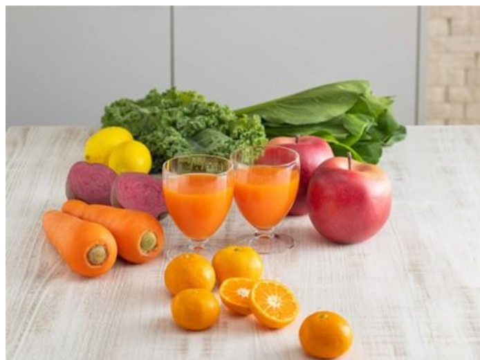
<「野菜生活 100 有田みかんミックス」グラスカットイメージ>