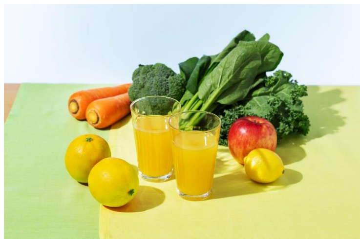
<グラスカットイメージ>