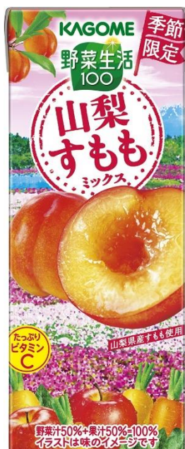
<グラスカットイメージ>

カゴメは、日本各地の野菜や果実を使用した商品を展開することで、日本の農業を応援いたします。