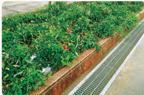
花壇を利用した例