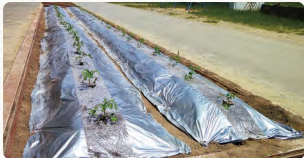
マルチシートで覆った畑