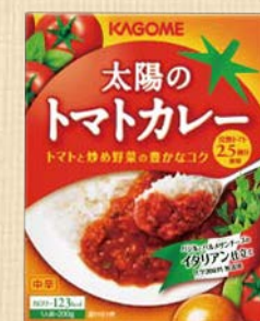
コンシューマー事業本部 商品企画部 / 増田瑠美子