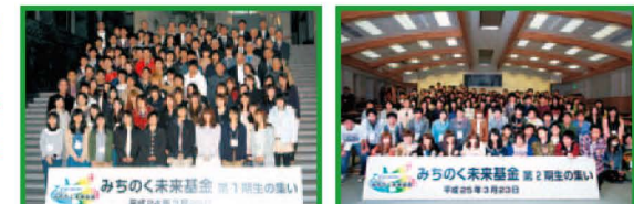
▲みちのく未来基金第1期生の集い ▲みちのく未来基金第2期生の集い

東日本大震災で親を亡くされた子供たちの高等教育進学のため、卒業までの授業料等費用(年間上限300万円)を返済不要の奨学金として給付しています。