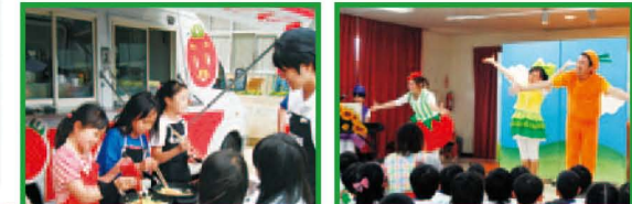
▲カゴメトマトキッチンカー ▲カゴメトマト劇場in東北