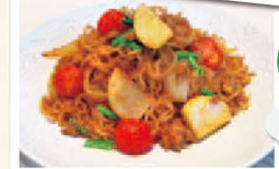
仙台・若林の「かぶ」を使って