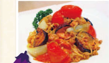
気仙沼の「なす」を使って