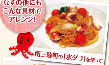
南三陸町の「水ダコ」を使って