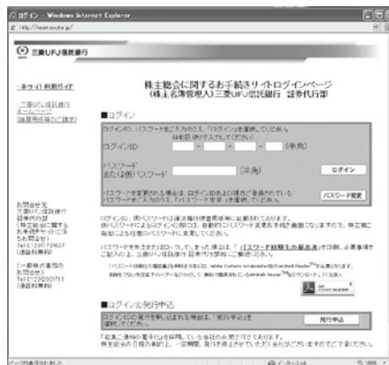
〈ログインID、パスワード〉入力画面