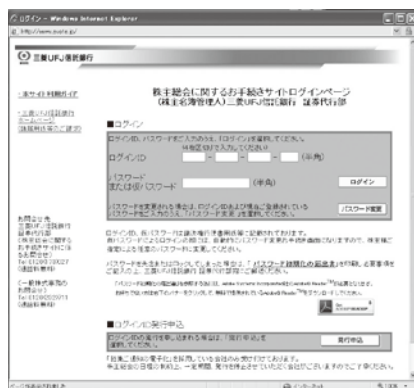
〈ログインID、パスワード〉入力画面