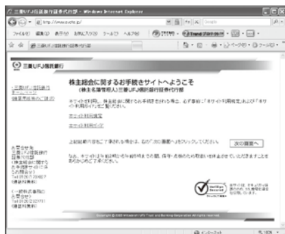
〈議決権行使サイト〉トップページ