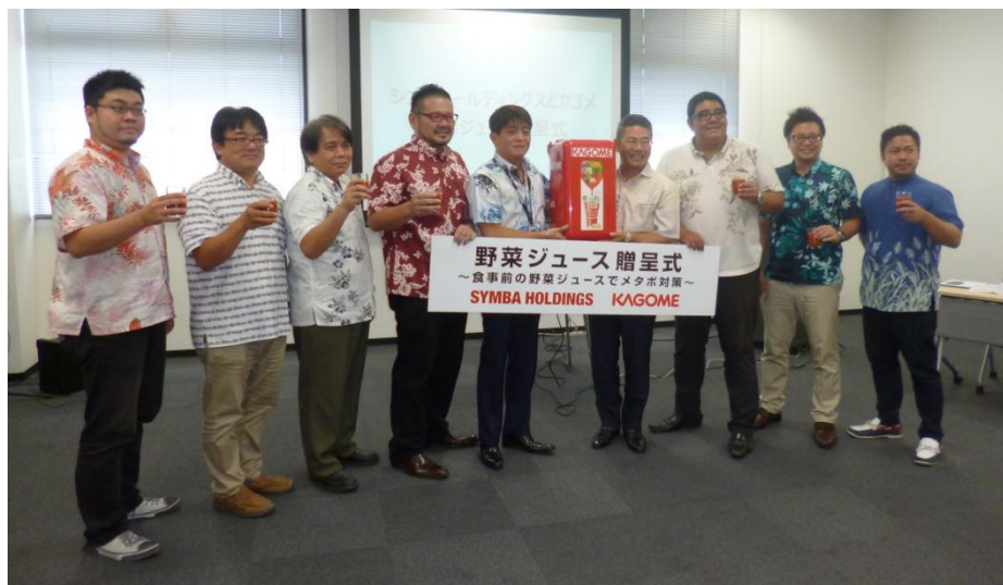
野菜ジュース贈呈式でのフォトセッションの様子