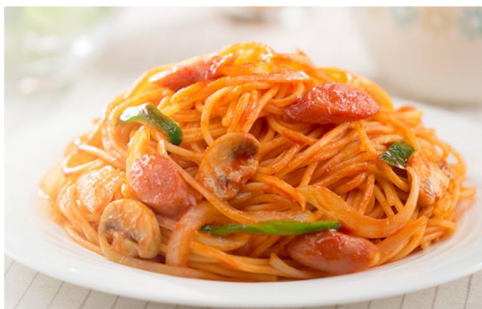
カゴメトマトケチャップ(500g)