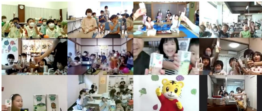
しまじろうと全国15箇所の子どもたち、野菜でカンパイ！

全国15箇所のこども食堂に集まった子どもたち約80名をオンラインでつなぎ、野菜について楽しく学べる授業を開催しました。「楽しかった」「しまじろうに会えて嬉しかった」等のたくさんの喜びの声があがり野菜について楽しく学べる機会となりました。