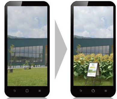
AR体験時に「ひまわり畑」が出現しているイメージ

AR体験コンテンツでは、季節によって様々に変化する野菜生活ファームのコンテンツを、AR技術を活用し、臨場感のあるバーチャル体験としてご提供します。畑などに設置されたARマーカースマートフォンのカメラで読み込んでいただくと、夏に楽しめる「ひまわり畑」が一望できたり、春から夏にかけて楽しめる巨大な「トマトの樹」が出現したりします。また、ARマーカース施設内の様々な箇所に設置されており、ラリー形式でお楽しみいただけます。「探す・発見・知る」という楽しいAR体験を拡充し、野菜や野菜が育つ畑を、季節を問わず体験していただくことで、野菜生活ファームでの体験価値をさらに高めてまいります。