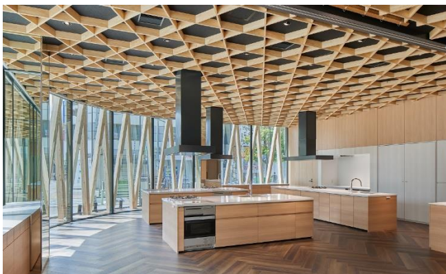
キッチンは、可動式間仕切りを収納すると隣接するプレゼンルームと一体運用が可能