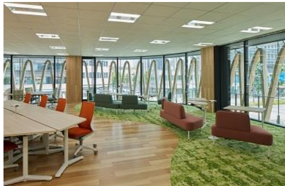
光あふれる執務スペース(2階)