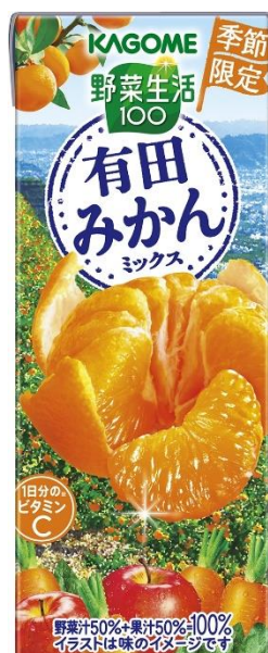
<グラスカットイメージ>

カゴメは、日本各地の野菜や果実を使用した商品を展開することで、日本の農業を応援いたします。