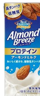
<アーモンド・ブリーズ プロテイン>