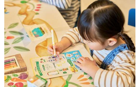
オリジナルパッケージづくり

カゴメの「野菜生活100」をヒントに、自分好みのオリジナルジュースを作ります。 ※作ったジュースは、持ち帰りはできません。