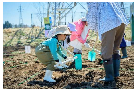
「うねうねチャレンジ」

ボックスに入った野菜の種の模型をさわって、芽→花→実へ育つまでの絵合わせゲームに挑戦します。