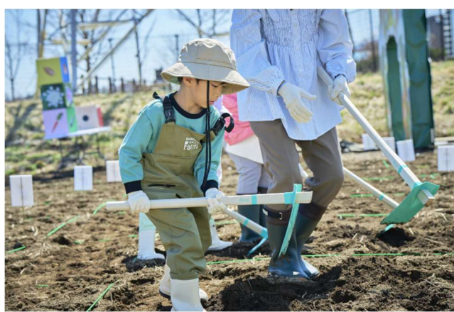
『“アリス”とめぐる畑のひみつツアー』の様子