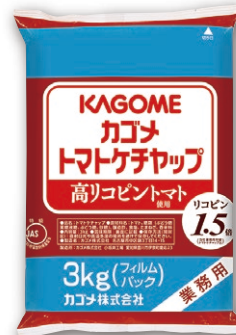
高リコピントマト使用 トマトケチャップ