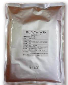
高リコピントマト使用 トマトペースト