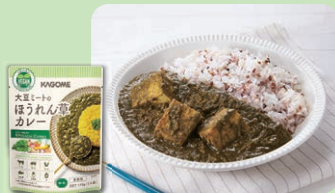
大豆ミートの ほうれん草カレー