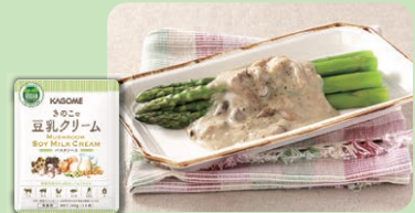
きのこの 豆乳クリーム