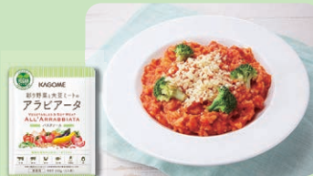
彩り野菜と大豆ミートの アラビアータ