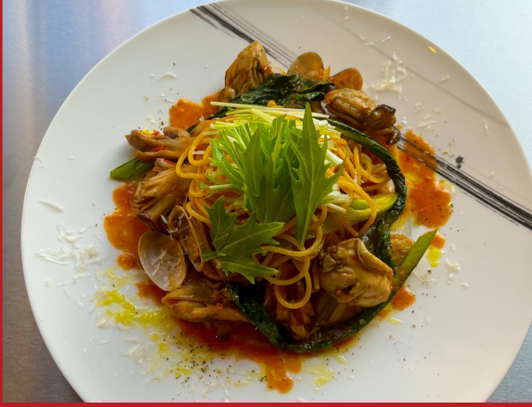
cuillère キュイール： 広島産の牡蠣と女鹿平まいたけのトマトパスタ