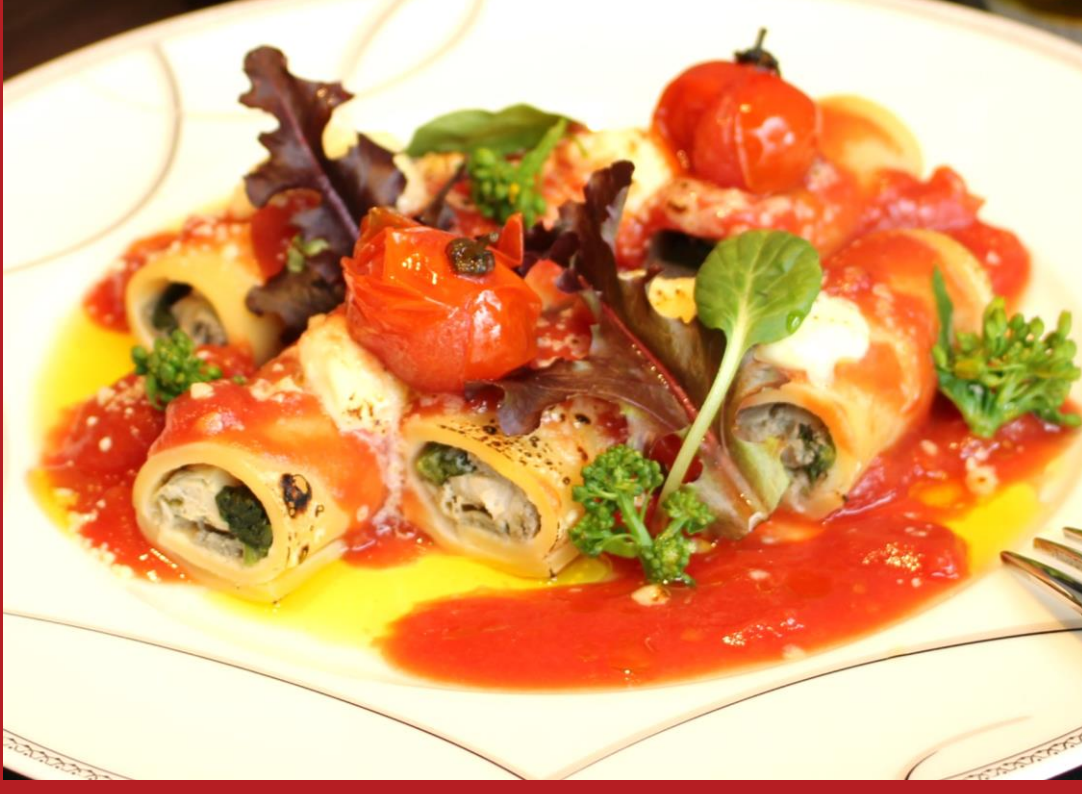
シェラトングランドホテル広島 ブッフレストラン「ブリッジ」： 小鯛・ちりめん・広島菜のカネロニ トマトソース仕立て 江田島レモンオイルの香り