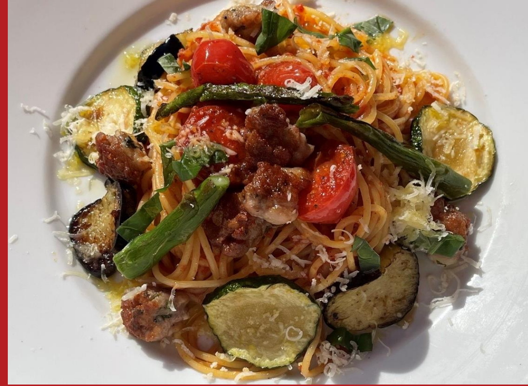
ピッツェリア マリオエスプレッソ袋町店： 広島産 豚肉のサルシッチャ 広島野菜のフレッシュトマト