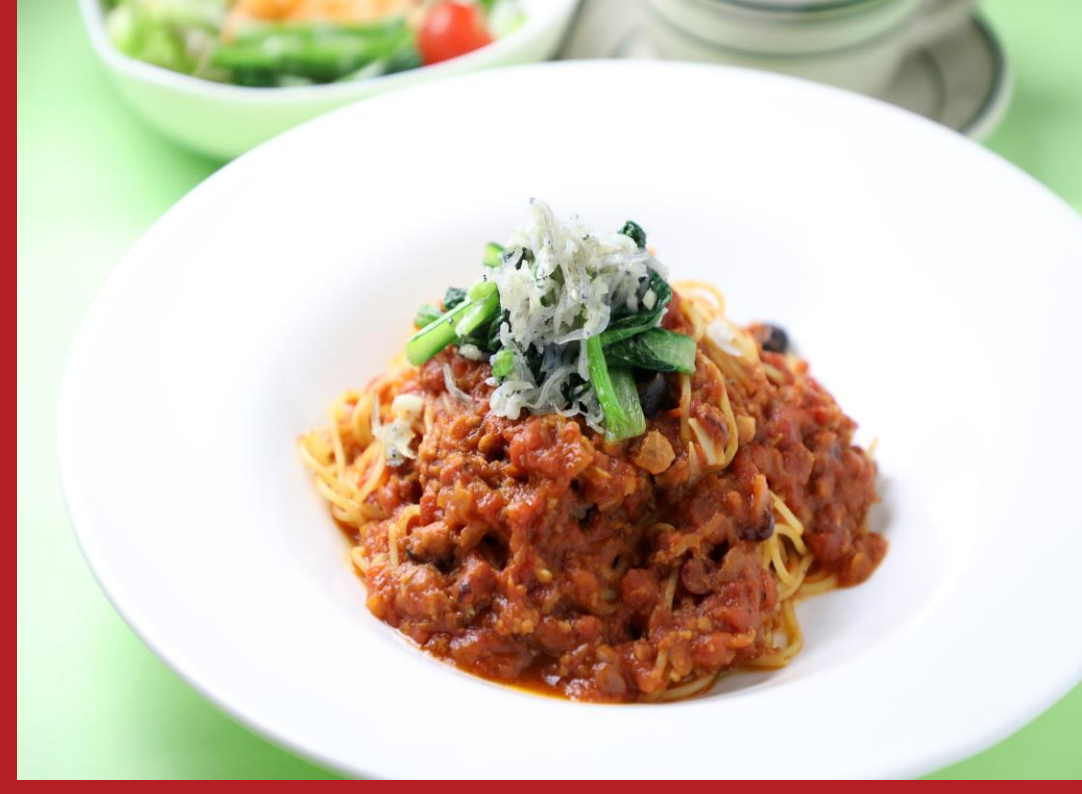
里山イタリアンAJIKURA 三越広島店： タコのラグー 広島県産しらす、小松菜