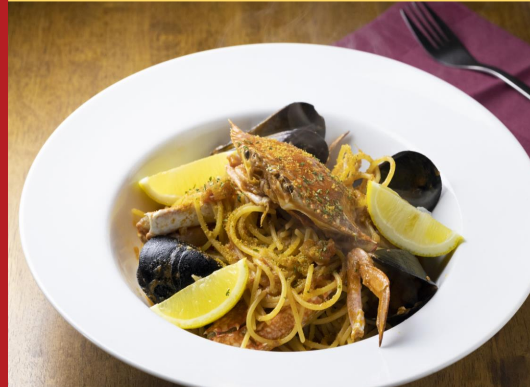
ラ・コシーナ・デ・セレーソ： レモンとカラシミ薫る 広島産ムール貝と渡り蟹のアラビアータ