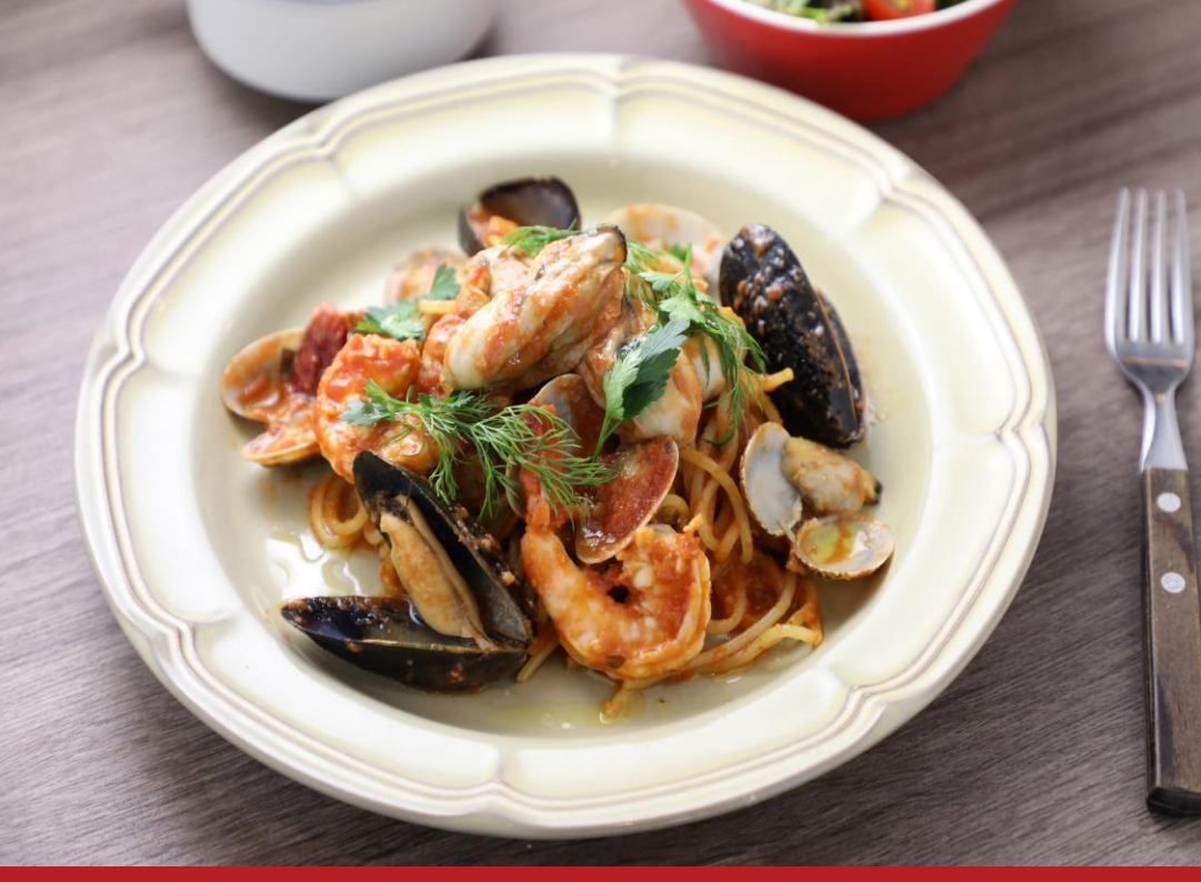
グリルレストラン&カフェー PACHO (パチョ)： 広島県産牡蠣と貝のペスカトーレセット