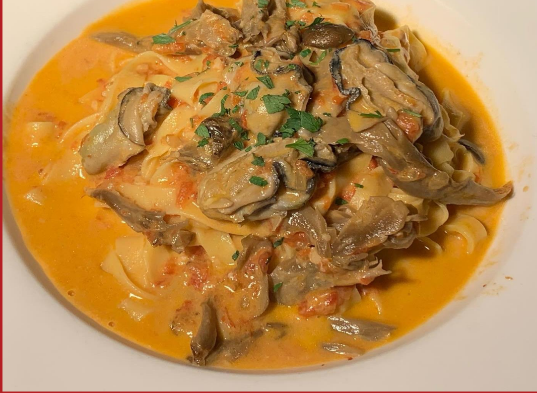
ピッツェリア マリオエスプレッソラクア緑井店： 広島牡蠣、女鹿平舞茸、キノコの トマトクリームタリアテッレ