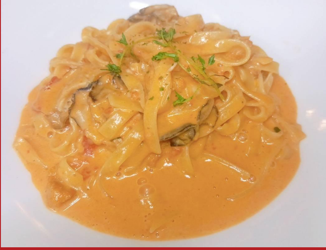
オイスターバー MABUI 広島駅前店： 牡蠣とウニのトマトクリームパスタ