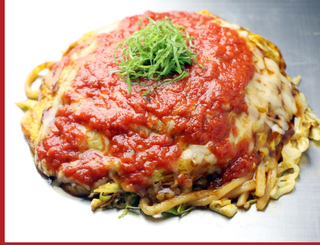
お好み焼・鉄板焼 ちんちくりん流川店： 広島パスタ風トマトチーズお好み焼き