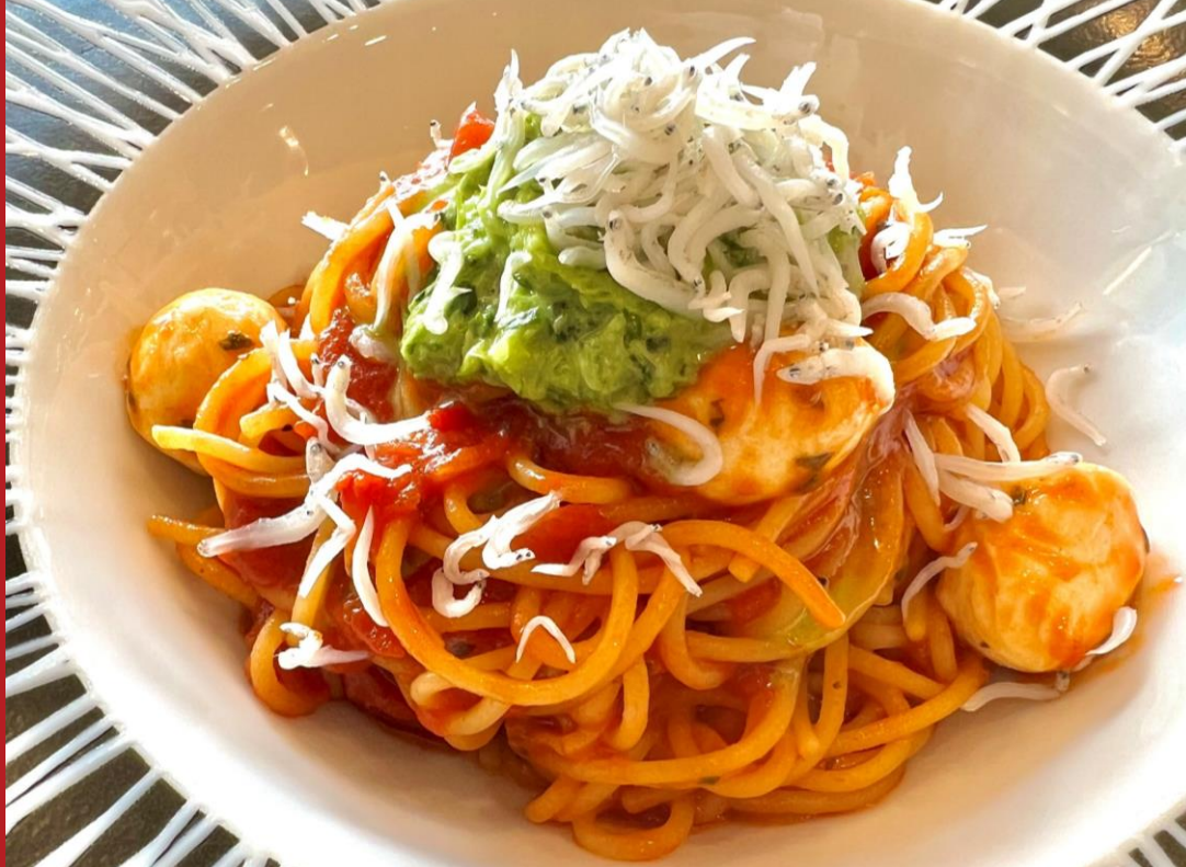
三河屋珈琲 パルティ坂店： 広島マルゲリータパスタ 〜広島菜のジェノベーゼ&しらすたっぷりのせて〜