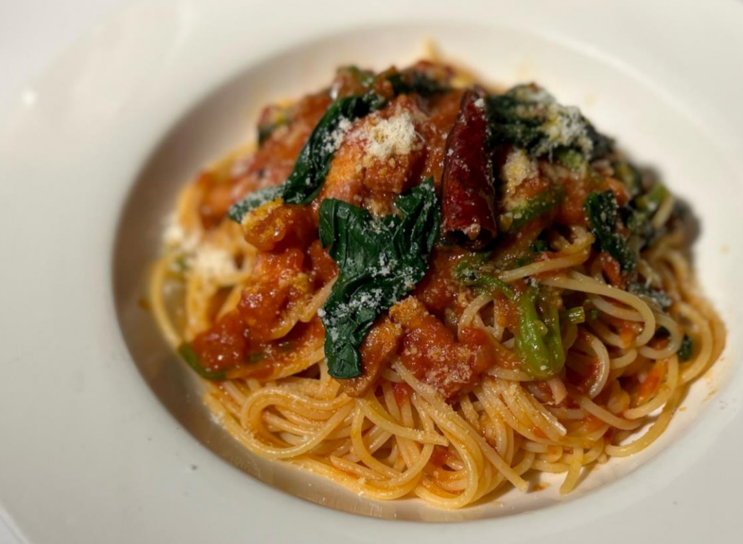
ピッツェリア マリオエスプレッソラクア緑井店： ベーコン、広島ホーレン草、ニンニク、 庄原ハバナロのトマトソーススパゲッティ