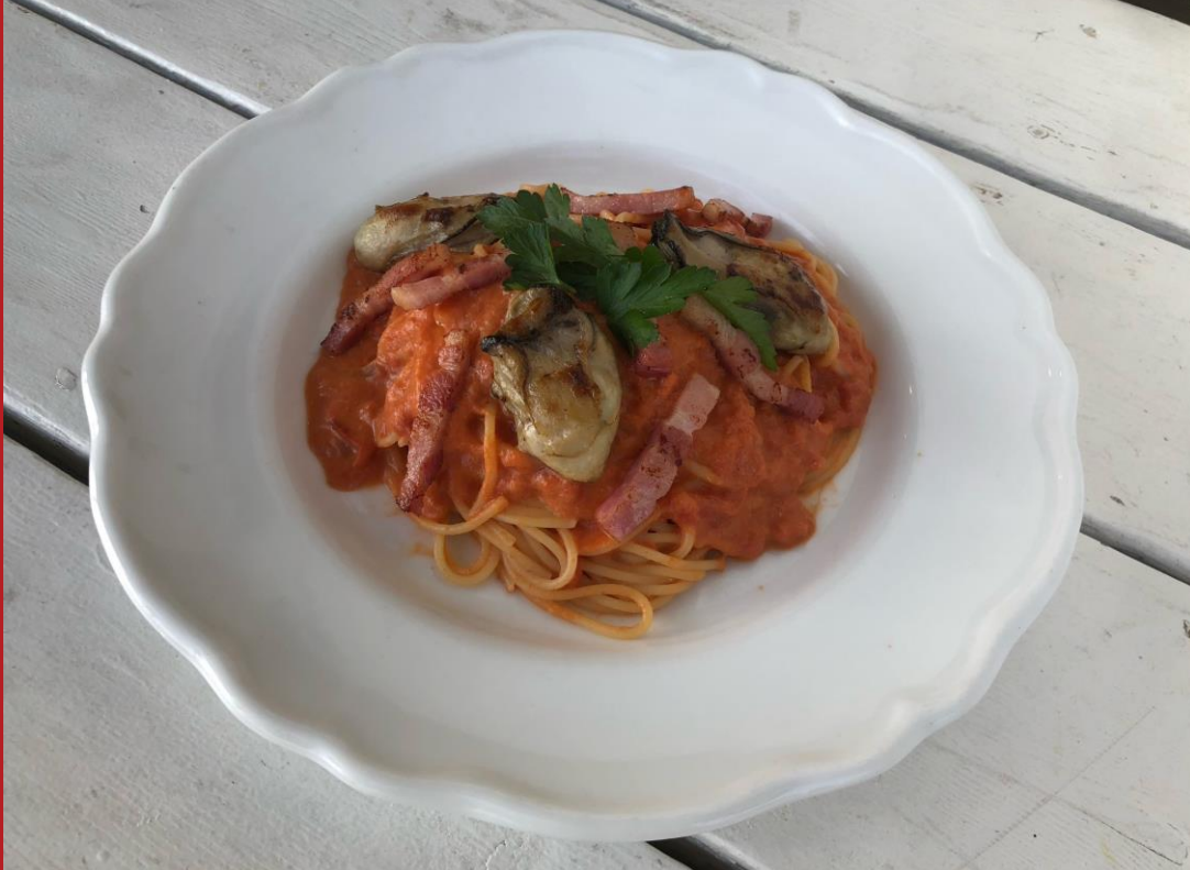
マリーナマリオエスプレッソ： 広島カキ、ベーコンのトマトクリームスパゲッティ