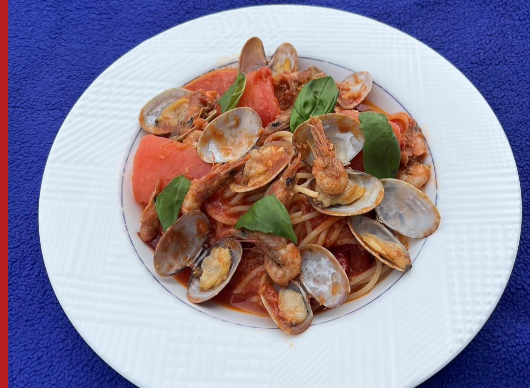
ピッツマリオ/マリオディマール： 大野あさりと地エビのトマトソース スパゲッティ