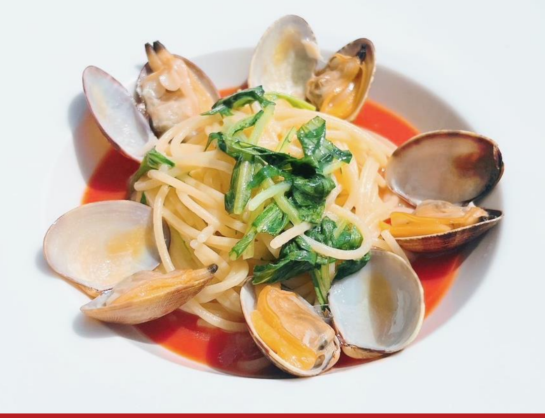
安芸グランドホテル 洋食レストラン「サンセット」： 大野産あさりのボンゴレロツツ