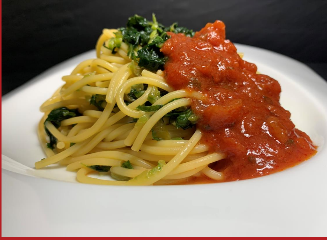
広島ガーデンパレス： 広島菜漬けとかき醤油のパスタ マリナラソース添え