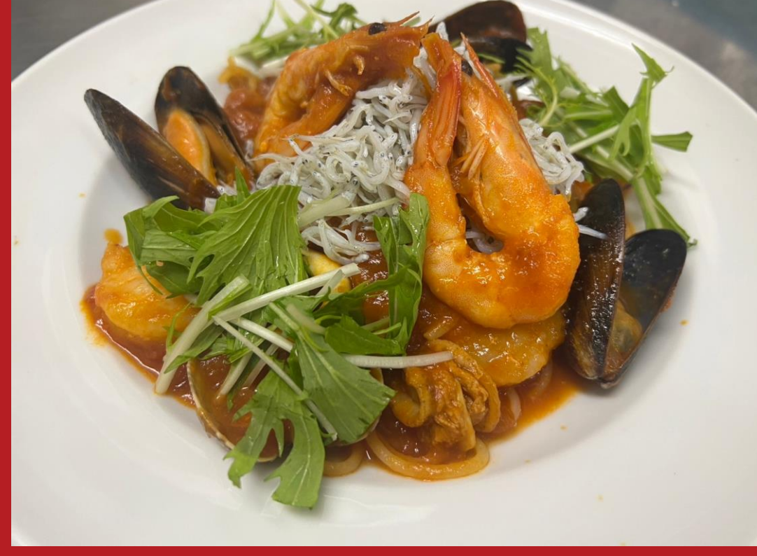
しらす専門店 SEALAS 福屋駅前店： 漁師自慢の海鮮パスタ