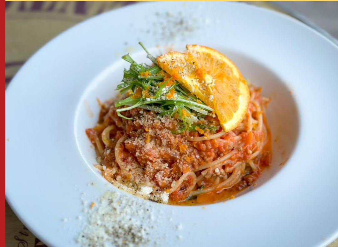
吉山BIANCO： 広島産オレンジ風味 鴨ミンチのポロネーゼ