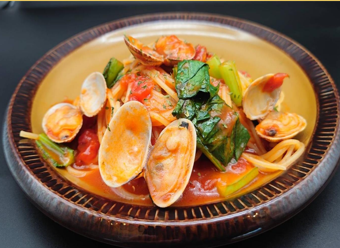
基町カフェ パリフル： 広島県産小松菜を使ったボンゴレロツツ