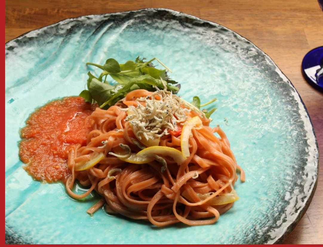
イタリア料理ソジヨルノ： 広島レモンと首戸ちりめんのアーリオオーリオ トマトのタリオリーニ 江田島産キングトマトのソース