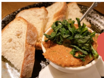
豚肉のハーブ仕込みのサルサディップ ～バゲット付～