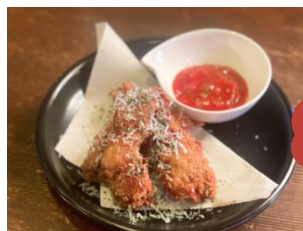
生ハムとアボカドのカツレツサルサソースディップ