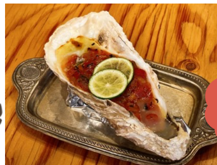
宮城県石巻産ブランド牡蠣【新昌】のサルサソース焼き