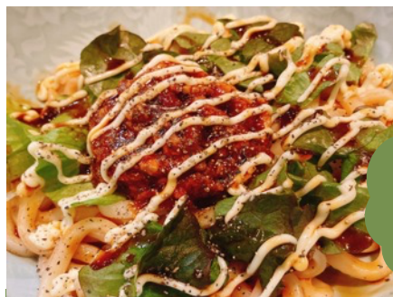
情熱のサルサうどん！