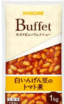
白いんげん豆のトマト煮

白いんげん豆を完熟トマトで煮込み、やさしい味わいに仕上げました。 解凍のみで手間なく提供可能です。