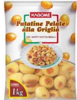
スモールポテトのグリル

しっとりした食感のイタリア産のポテトです。オーブンで焼くだけで提供可能。 冷めてもおいしいのが特徴です。