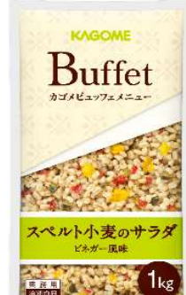
スベルト小麦のサラダ ビネガー風味

スベルト小麦をワインビネガーとオリーブオイルで和えました。 解凍のみで手間なく提供可能です。