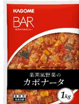
菜園風野菜のカポナータ

イタリア産のうま味豊かな野菜を濃厚なトマトソースで煮込みました。 解凍のみで手間なく提供可能です。