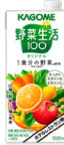
ホテル レストラン用 野菜生活100 オリジナル