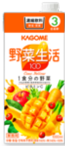
野菜生活100 イエロー （3倍濃縮）