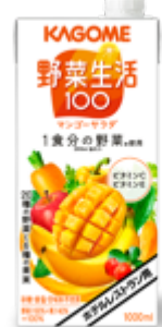
ホテル レストラン用 野菜生活100 マンゴーサラダ