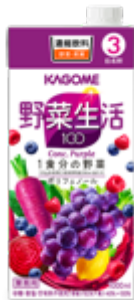
野菜生活100 パープル （3倍濃縮）