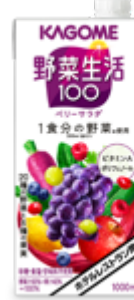
ホテル レストラン用 野菜生活100 ベリーサラダ