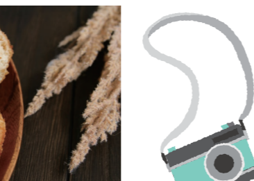
パン以外のものを使用した過度な装飾