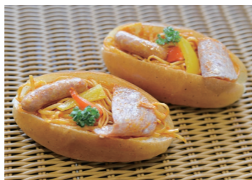
パン(同じパンを複数)