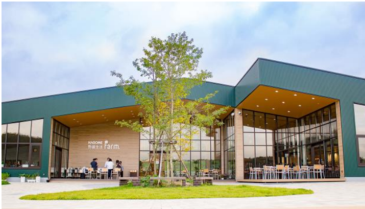
カゴメ野菜生活ファームの外観 (テラス側)

今年も、何度も訪れたくなる野菜のテーマパークとして、野菜生活ファームならではの体験コンテンツを展開いたします。