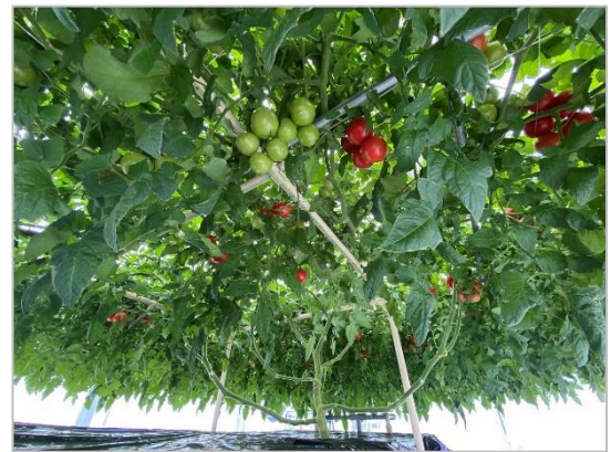
昨年9月に種を植えて育てた「トマトの樹」 (2024年3月現在)