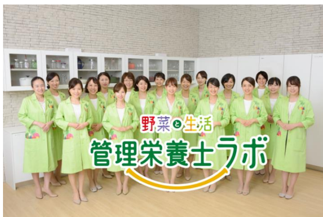
「野菜と生活 管理栄養士ラボ」メンバー

当社は2018年10月に健康事業部を立ち上げ、主に法人や自治体むけに、健康増進をサポートするサービスを開発・販売しています。食と健康のプロである当社の管理栄養士によるプロジェクトチーム「野菜と生活 管理栄養士ラボ」がその一翼を担い、トマトをはじめとする野菜に関する知見やメニューレシピの開発力を活かして、野菜摂取の重要性や野菜を普段の食生活に上手に摂り入れる方法を学べるセミナー、手軽に野菜が摂れるメニューレシピなどを開発・販売しております。また企業や大学むけの食育コンサルティングも行っております。