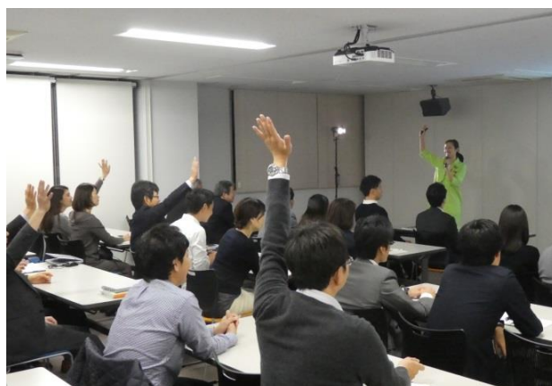
健康セミナーの様子